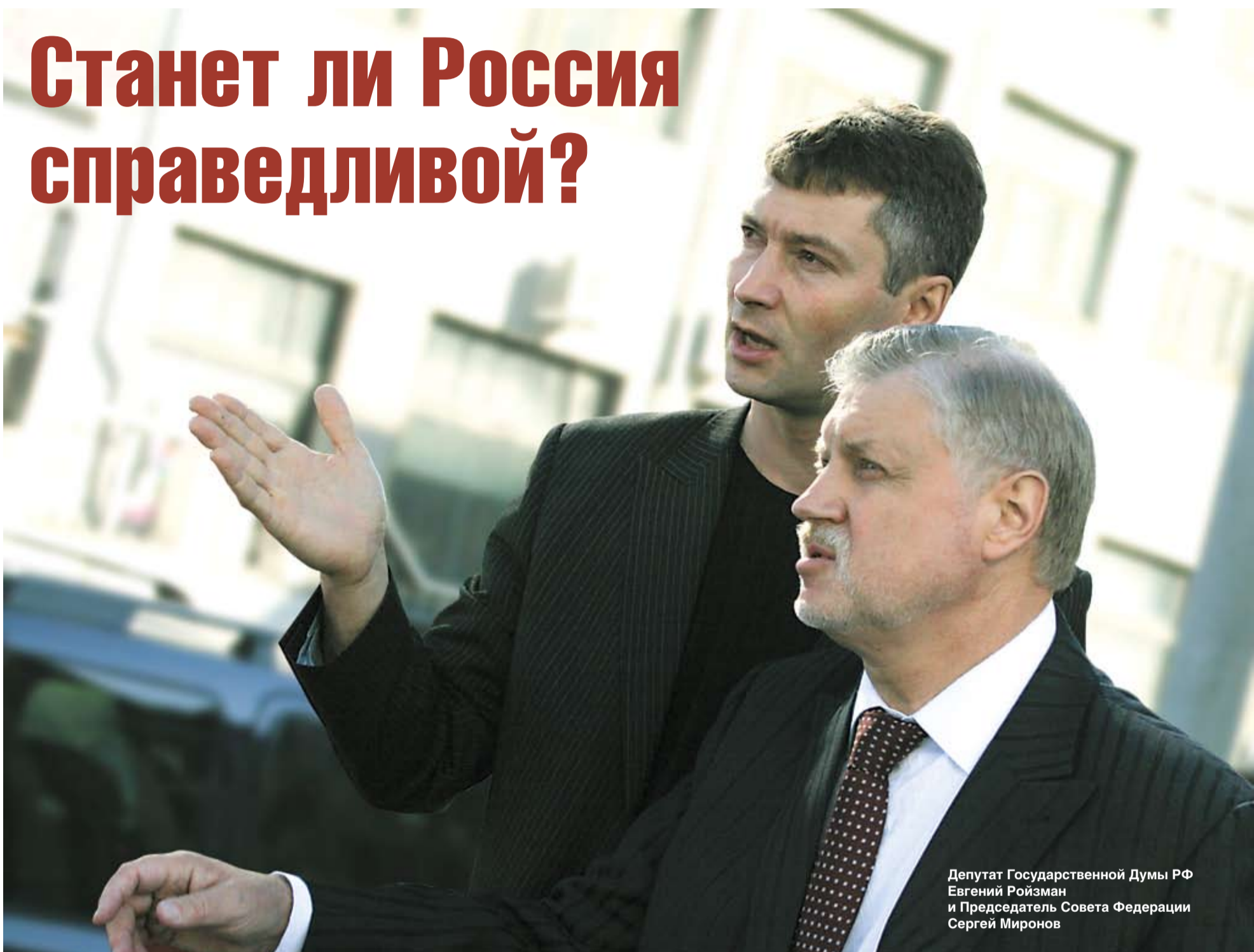
Депутат Государственной Думы РФ Евгений Ройзман и Председатель Совета Федерации Сергей Миронов

Несправедливость — одна из главных проблем российского общества. На протяжении веков несправедливость власти по отношению к простым людям возмущала передовых граждан нашей страны, заставляя их искать выход из этой ситуации.