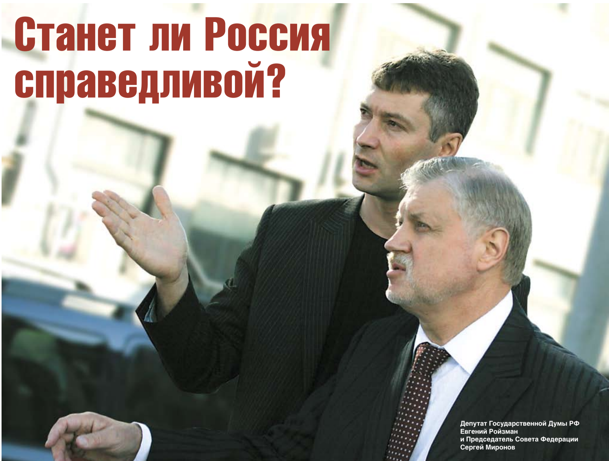
Депутат Государственной Думы РФ Евгений Ройзман и Председатель Совета Федерации Сергей Миронов

Несправедливость — одна из главных проблем российского общества. На протяжении веков несправедливость власти по отношению к простым людям возмущала передовых граждан нашей страны, заставляя их искать выход из этой ситуации.