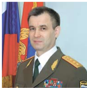
Глава МВД РФ Рашид Нургалиев

авторитетами. Правда, зря все это, скорее всего, прокуратура уже взяла под контроль расследование по этому делу. Остается только надеяться, что угрозы угрозами и останутся, а герои этого дела не пострадают.