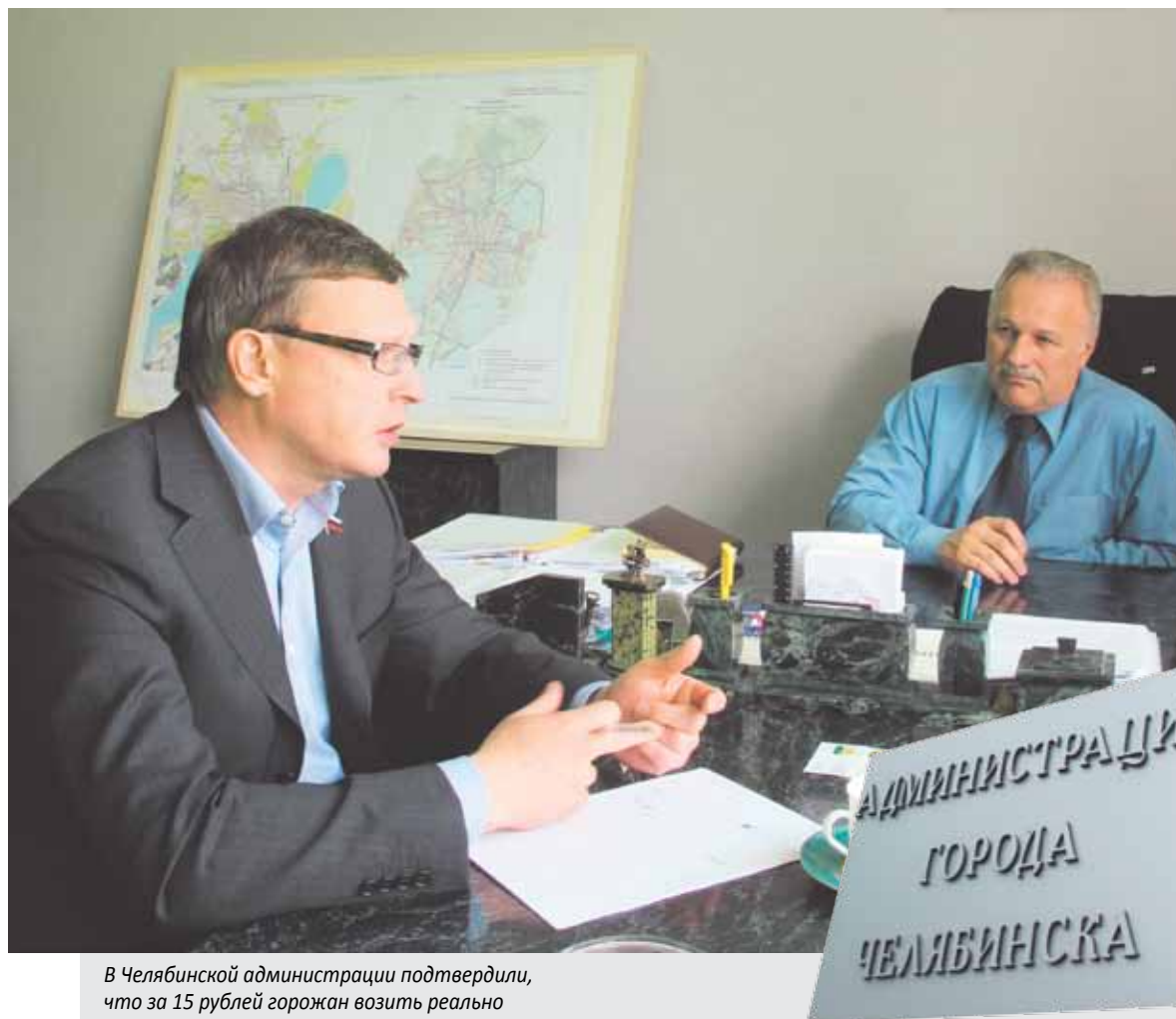
В Челябинской администрации подтвердили, что за 15 рублей горожан возить реально