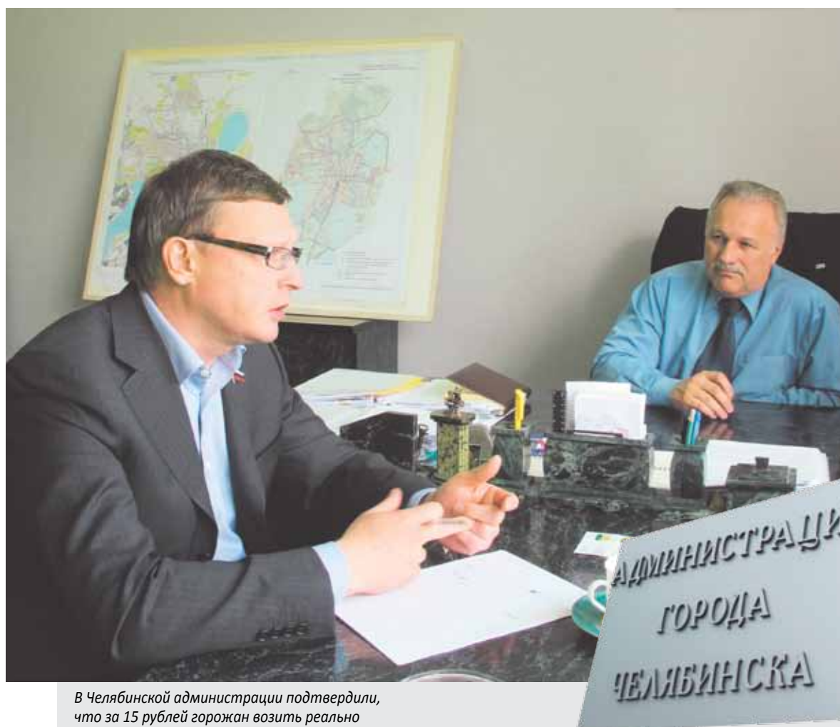
В Челябинской администрации подтвердили, что за 15 рублей горожан возить реально