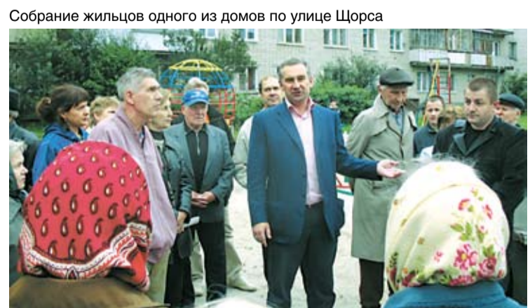
Собрание жильцов одного из домов по улице Щорса

Между тем, по результатам проверки прокуратуры Свердловской области Евгений Ройзман планирует добиться от надзорных органов всей необходимой информации для оценки ситуации и принятия мер на уровне Государственной Думы, которые позволили бы оградить население от подобных нарушений.