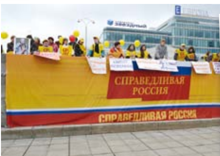
На площади 1905 года справедливороссы растянули 9-метровый флаг партии