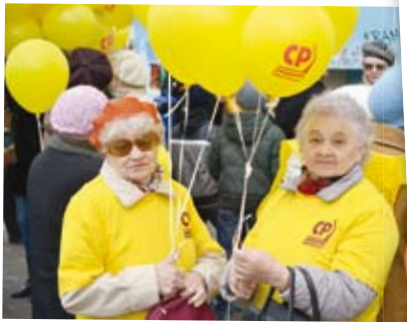
«Хорошие девочки – заветные подруги...»