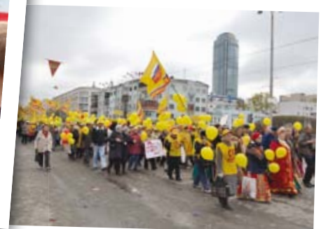
В колонне СПРАВЕДЛИВОЙ РОССИИ – более 1000 человек!