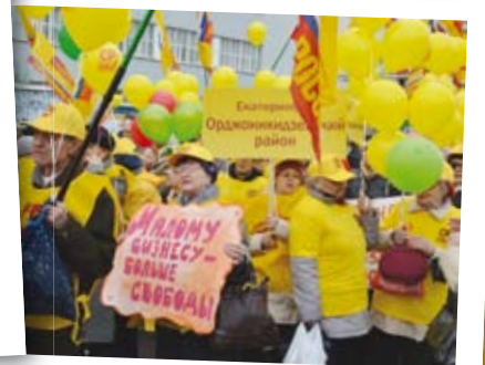
Старшее поколение печется о судьбе своих внуков, которым предстоит жить, строить семьи и развивать бизнес в нашей стране!