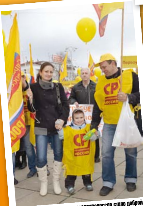
Участие в шествии для справедливороссов стало доброй семейной традицией!