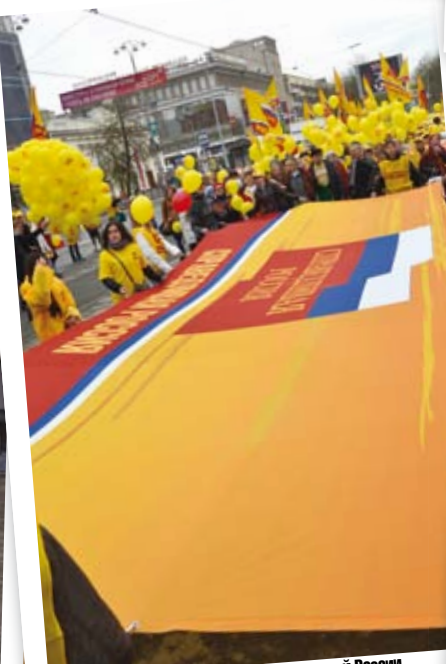
Активисты молодежного крыла Справедливой России