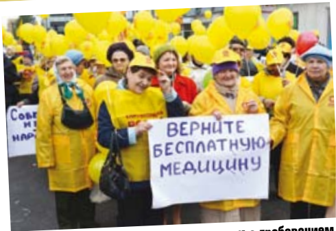
Дети войны – участники шествия вышли с требованием вернуть бесплатную медицину