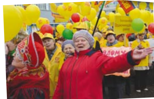
Веселой, дружною толпою участники шествия шли по проспекту Ленина!