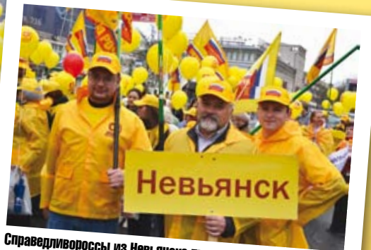
Справедливороссы из Невьянска приехали в Екатеринбург специально ради Первомайского шествия