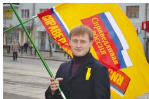
Александр Караваев, председатель фракции СПРАВЕДЛИВАЯ РОССИЯ в Законодательном Собрании Свердловской области