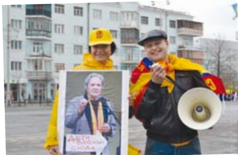
Хорошее настроение и правильный креатив – визитная карточка пресс-службы партии