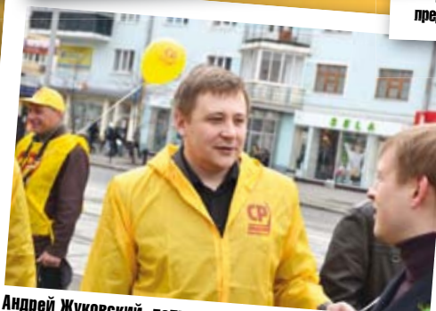
Андрей Жуковский, депутат от СПРАВЕДЛИВОЙ РОССИИ в Законодательном Собрании Свердловской области