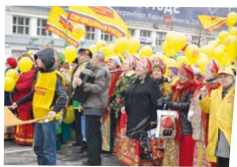
Народный хор «Уральские края» радовал всех исполнением любимых и дорогих сердцу песен