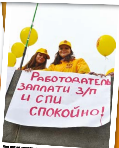
Этот лозунг актуален до сих пор