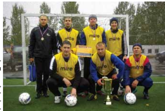
Будущие звезды ЧМ - 2018

был финал. В итоге сильнейшей в серии пенальти оказалась «Виктория».