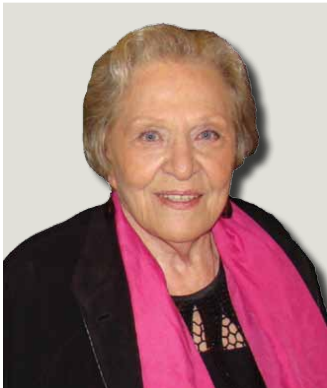
Римма Маркова была рада приехать на Урал

Народная артистка России, лидер общенационального Движения «ДЕТИ ВОЙНЫ» прилетела в Екатеринбург, чтобы вместе с 48 тысячами непризнанных властью уральцев защитить закон справедливоросов.