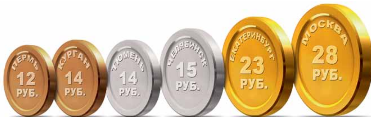
Екатеринбург по стоимости проезда в общественном транспорте уступает лишь Москве

Между тем новости из соседних городов-миллионников, еще раз наталкивают на мысль что решение о повышении проезда могло быть скоропалительным и приниматься только с учетом интересов транспортников.