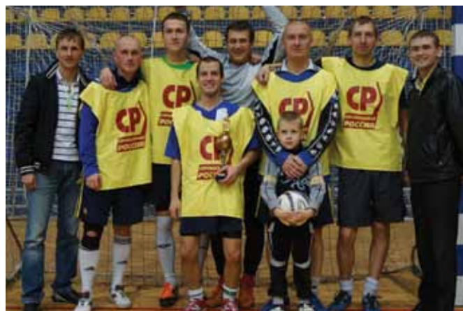
СП - самая спортивная партия

Первый турнир «Кубок Русфана - 2011» с участием более 300 спортсменов был организован при поддержке депутата Государственной Думы РФ Александра Буркова и депутата городской думы Екатеринбурга Геннадия Ушакова. Десятки молодых футболистов с радостью приняли участие в прошлогоднем турнире. Чтобы поиграть в футбол, командам необходимо платить заявочные взносы, на турниры подобного рода, от 20 тыс. рублей и выше, что является неподъемной суммой для студентов, школьников. Мы решили искоренить такую несправедливость, для этого и был организован бесплатный турнир для молодежи, чтобы парни могли развивать свои таланты, совершенствоваться, вести здоровый образ жизни и завоевывать самые высокие места. Именно развитие любительского спорта и популяризация футбола стали основными целями серии турниров «Кубок Русфана» в Екатеринбурге. Наш город – единственный в России, где фанаты устраивают такие соревнования. »