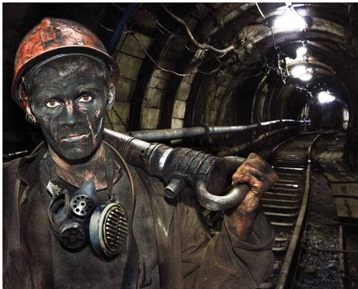
«Черные будни» уральских шахтеров не закончатся и после выхода на пенсию

«Как только олигарх Дерипаска заявил о закрытии электролизного производства на Богословском алюминиевом заводе, что непременно провоцирует остановку рудника в Североуральске, свердловские единороссы дали обещание принять специальный закон для местных шахтеров на федеральном уровне. Но как только закон Буркова внесли в повестку, единороссы Госдумы забыли об обещаниях.»