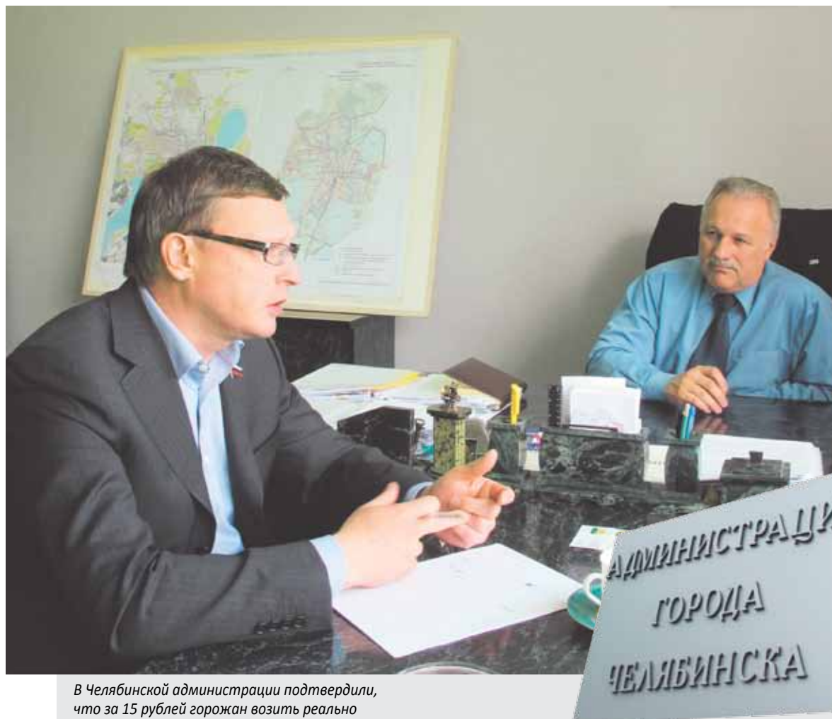
В Челябинской администрации подтвердили, что за 15 рублей горожан возить реально