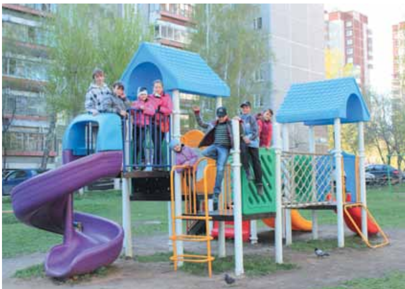
На строительство детской площадки из полученных денег потрачено 800 тысяч рублей

Это доказали жильцы дома № 6 по улице Высоцкого