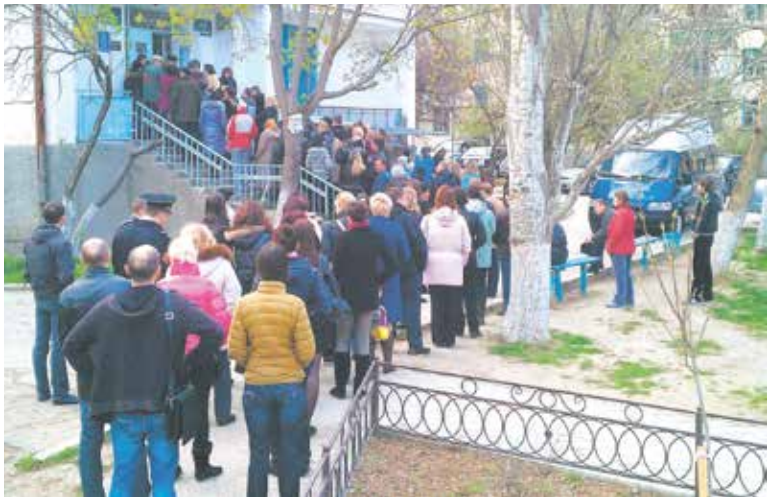
Пока выстоишь очередь за талончиком, разболеешься еще сильнее

Для того чтобы попасть на прием к врачу в государственную поликлинику, екатеринбуржцы вынуждены стоять в очередях. «Винovat» в страданиях пациентов жесточайший кризис медицинских кадров.