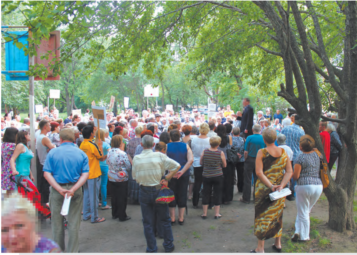
Против коммунального беспредела выступили более 400 жителей

Жители микрорайона «Авангард» прожили 78 дней без горячей воды