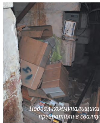
Подвал коммунальщики превратили в свалку

Чиновники Железнодорожного района даже не знают, что происходит на Сортировке! Власти рапортуют о полном порядке, а на самом деле жильцы дома стонут от полного беспредела распоясавшихся коммунальщиков.