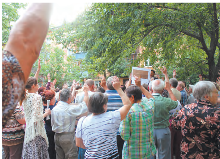
Жители единогласно проголосовали за создание Совета микрорайона

При поддержке «Справедливого ЖКХ» жители микрорайона «Авангард» научились держать коммунальную оборону.