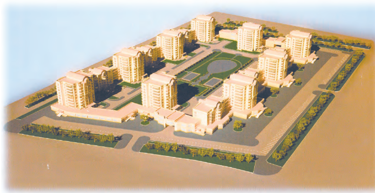
Квартал многоэтажной и смешанной застройки

А тех, кто готов строить и продавать квартиры по 35 000 рублей за квадратный метр, – к строительству в пределах Екатеринбурга не подпускают!