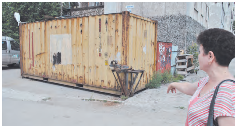
Двор заставлен контейнерами, которые коммунальщики превратили в склады

Мы написали в прокуратуру, жилинспекцию, в управляющую ком-