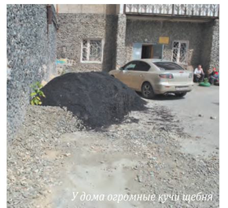
У дома огромные кучи щебня

года. В декабре получили ответ из администрации района: техника, контейнеры и стройматериалы убраны. Но увезли их только на бумаге!