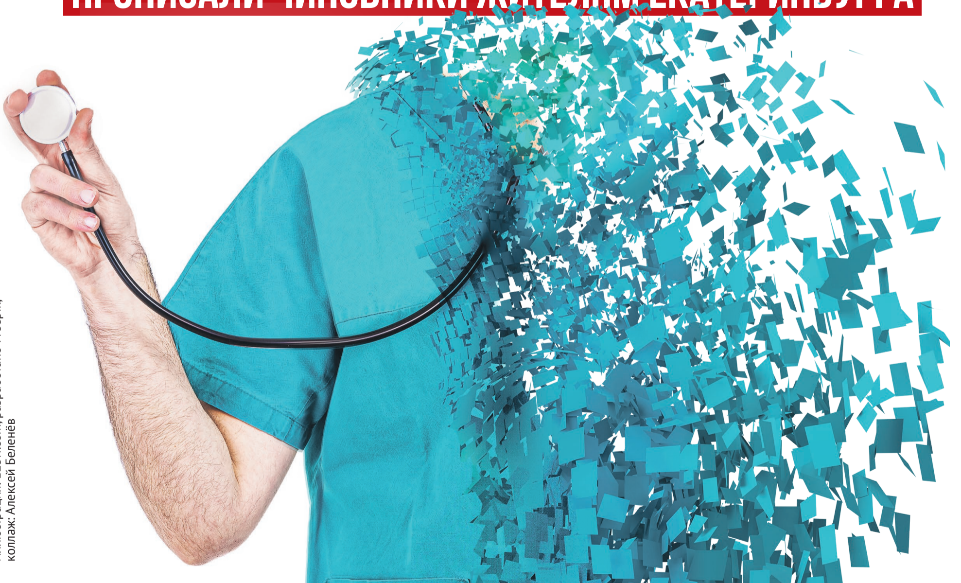
Иллюстрация: 123rf.com, разработано Греерік, коллаж: Алексей Беленёв

ПРОПИСАЛИ ЧИНОВНИКИ ЖИТЕЛЯМ ЕКАТЕРИНБУРГА