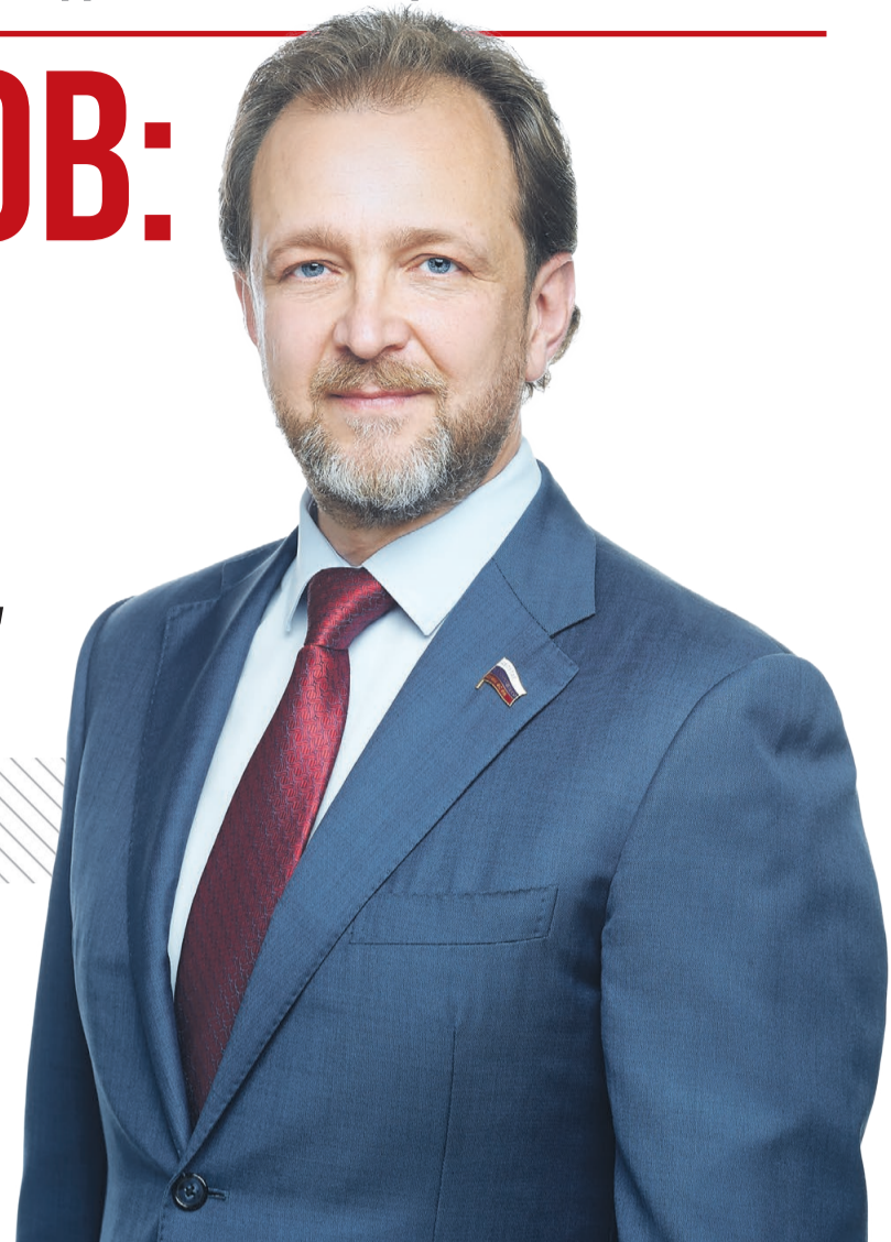
Депутат Госдумы РФ, лидер Свердловского регионального отделения справедливороссов, руководитель сети Центров защиты прав граждан

Девятого и десятого сентября Екатеринбург выбирает депутатов в городскую Думу